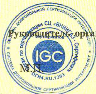
Схема сертификации 2с.